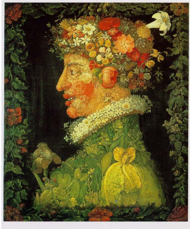
Abb. 6 'Herbst' und Frühling', Gemälde von Giuseppe Arcimboldo (1530 – 1593), Musée du Louvre, Paris.